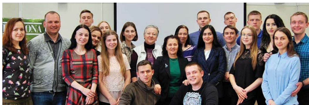
Участники семинара «БЕЛЛОНЫ» в Томске 25–26 апреля 2019 года, Юридический институт Томского государственного университета.

С 2013 года для студентов, участвующих в конкурсе «ЭКО-ЮРИСТ» и показавших хорошие результаты, организуются семинары по экологическому праву. Студенты знакомятся с методикой анализа законодательства и практикой защиты экологических прав граждан.