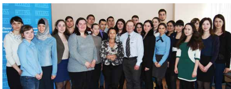
Участники семинара в Стерлитамаке. 11-12 апреля 2017 года, Стерлитамакский филиал Башкирского государственного университета.

С 2013 года для студентов, участвующих в конкурсе «ЭКО-ЮРИСТ» и показавших хорошие результаты, организуются семинары по экологическому праву. Студенты знакомятся с методикой анализа законодательства и практикой защиты экологических прав граждан.